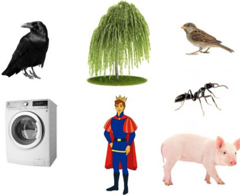
vrana, vŕba, vrabec, mravec, práčka, princ, prasa

Nechajte dieťa pomenovať, čo vidia na obrázkoch. Keď bude výslovnosť dieťaťa správna, spájajte slovo s prídavným menom (zelený kufor, veľký kufor). V ďalšej etape tvoria krátke vety: Dostal som teplý sveter.