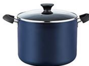
trúbka, tričko, brána, mrkva, mrak, hrniec, koruna, darček