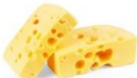
meter, sveter, syr, kufor

Logopedické cvičenia na precvičovanie hlásky R